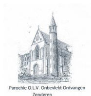
Parochie O.L.V. Onbevleekt Ontvangen Zenderen